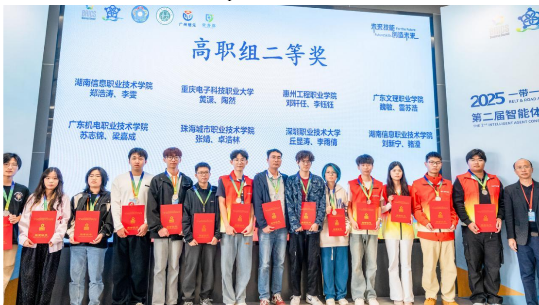
图 2-6 师生参加智能体比赛获国家级二等奖 2 项

合作成果媒体报道十余次。呈现了校企双方于协同育人领域的创新实践，进一步拓展了合作项目的社会影响力，为更多职业院校与企业开展深度合作提供了参考范例。经媒体广泛传播，学校的办学特色与育人成效获社会各界高度认同，吸引了更多优质