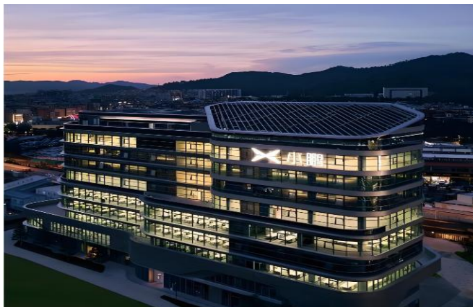
图 1-2 小鹏汽车广州总部