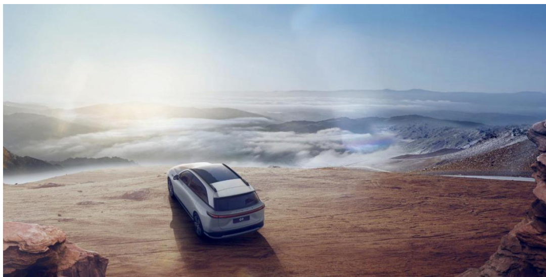
图 1-1 小鹏汽车-未来出行探索者

家用大七座车型标杆。市场表现持续亮眼，2020 年先后登陆纽交所（股票代码：XPEV）和香港联交所（股票代码：9868.HK），2025 年前 11 月累计交付量达 39.19 万台，同比增长 156%，毛利率稳定在 20% 以上；海外业务已拓展至 60 多个国家和地区，2025 年新增立陶宛、柬埔寨等七国市场，前 11 月海外交付量 3.98 万台，同比增长 95%，海外网点增至 321 个。行业影响力与可持续发展能力广受认可，连续三年荣获 MSCI ESG “AAA” 全球最高评级，获评上海气候周 “气候灯塔·供应链典范奖”，并与大众汽车达成核心技术合作，已成为中国智能电动汽车领域技术创新与全球化发展的重要力量。