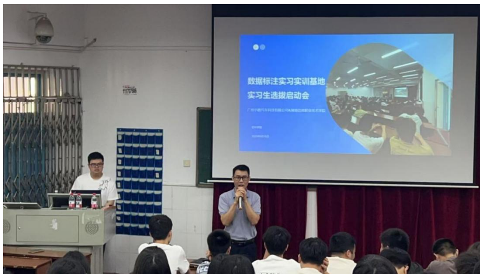
图 2-2 数据标注实训基地实习生选拔启动会

接；在师资队伍建设上，推行“双师双导”模式，学校选派专业教师参与小鹏汽车专项培训并获取企业认证资质，同时企业资深技术专家以“双师型”教师身份入校授课，通过实战教学传授数据标注前沿技术与行业经验；在实践平台搭建上，共建人工智能数据标注实训基地，为学生提供沉浸式项目化实训场景，让学生直接参与车道线识别、目标检测等真实智驾数据标注工作，实现理论知识与实操技能的无缝转化；在技能提升与评价上，建立“实训 - 认证 - 激励”的闭环机制，学生标注的高质量数据直接应用于小鹏智能驾驶系统训练，通过企业认证考核的学生可纳入企业人才库，同时通过专项表彰等形式激发学习积极性，形成“标准共建、教学共施、平台共享、成果共通”的成熟办学格局。