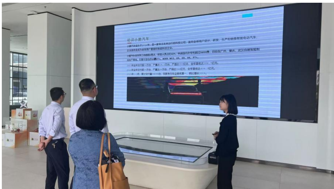
图 3-2 软件学院、校企合作处相关负责人在广州小鹏汽车科技有限公司调研