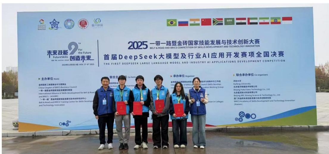
图 2-5 师生参加首届 DeepSeek 大模型比赛获国家级三等奖 2 项