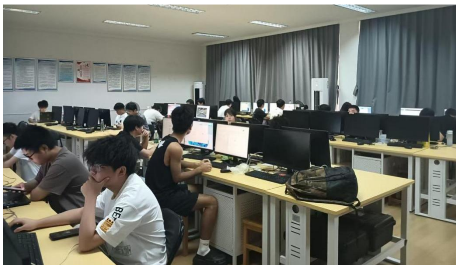
图 4-1 数据标注基地实训室

我院为小鹏数据标注项目专门安排了一间位于实训楼二层、面积约八十平方米的教室。该教室采光充足、通风良好，配备了全新的课桌椅、空调系统以及独立专线网络，可同时容纳五十名学生开展项目实训。教室内专门配置了 51 台高性能计算机，均安装有数据标注所需的专业软件，如 Labellmg、VGG Image Ann otator 等，以及相关的图形处理工具和数据库管理系统，以确保学生能够流畅、高效地完成数据标注的各项操作任务。此外，教室后方设置了资料存储柜，用于存放项目相关的纸质文档、数据备份硬盘等材料，便于师生随时查阅和取用，为项目的顺利开展提供了坚实的硬件保障。