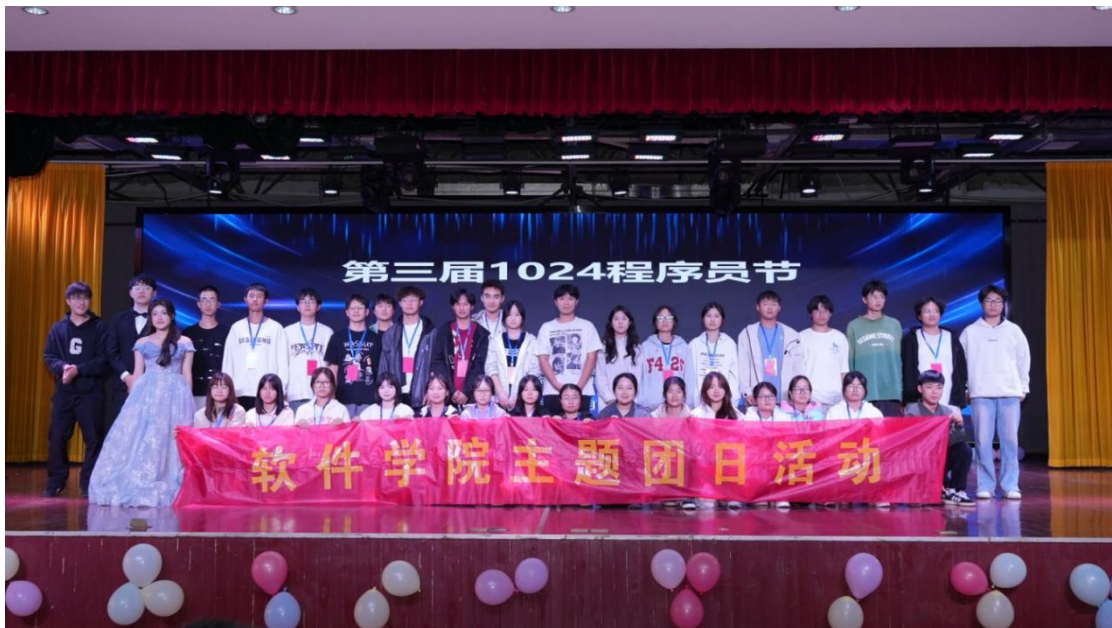
图 3-4 1024 程序员节