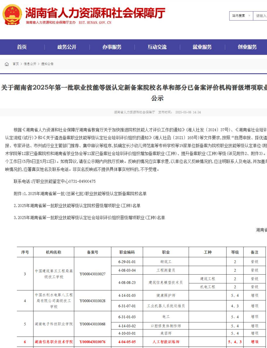
图 2-4 湖南省人力资源和社会保障厅主管的人工智能训练师题库立项